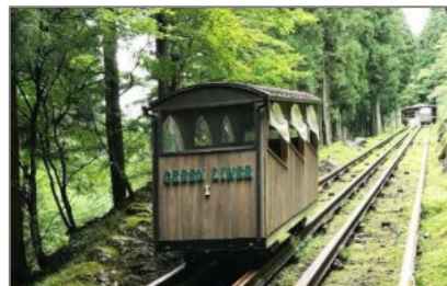
大滝鍾乳洞

弊社から車で約10分程度の場所にある「大滝鍾乳洞」をご紹介します。総延長2kmの東海地区最大級の石灰洞窟で、現在は鍾乳石がよく見える約700m程が公開されています。大滝鍾乳洞は乳白色のものが多く、金属イオンを含んだ赤色や光が透けるような透明度の高いもの等、様々な鍾乳石を見ることができます。また、鍾乳洞までは木製のケーブルカーに乗って向かうので、ちょっとした冒険気分も味わえます。暑い季節にひんやりと涼しいスポットへ是非お出かけください。