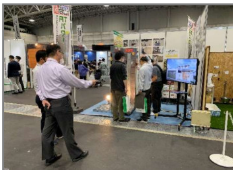
E & G 2022