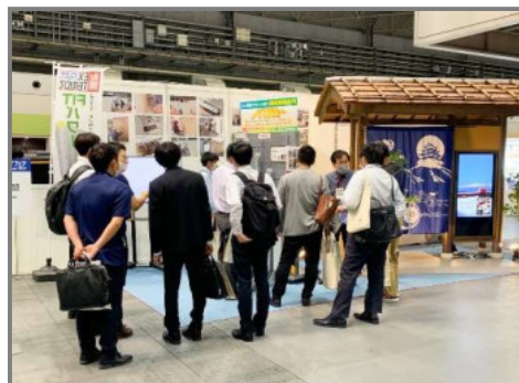
関西エクステリアフェア2022

新型コロナウイルス感染症の影響で3年ほど中止していた展示会が無事に開催され、本年度に出展予定だった展示会すべてが大盛況のうちに閉幕しました。